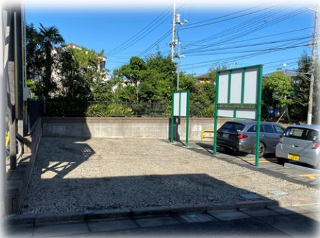
片瀬5丁目 住宅・店舗等汎用性のある土地を2分割で分譲