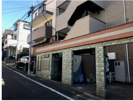
[カステイロ上池台] 大田区上池台 戸数：25戸

多様化するオーナーさまの資産活用ニーズにお答えできるよう、 アイ・ラックがお客様をしっかりとサポートいたします。