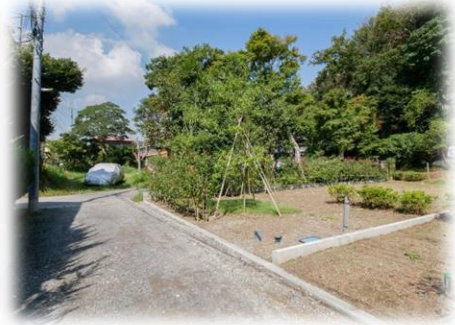
鎌倉市中規模開発（2宅地）分譲宅地