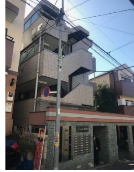
[シャンテーム元住吉] 川崎市中原区井田 戸数：8戸