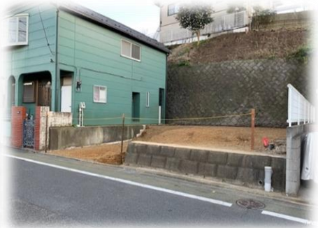
プラン付 分譲宅地